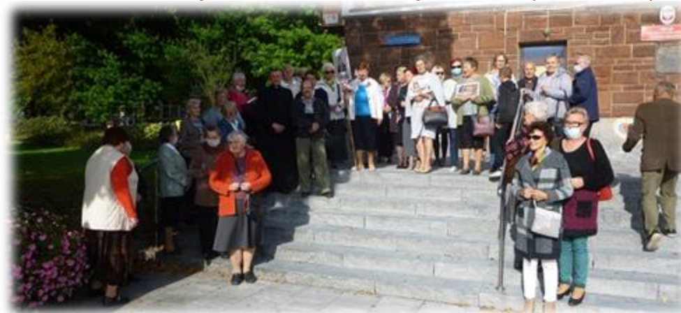
Dwa ujęcia fotograficzne – z KORONKI NA ULICACH MIAST ŚWIATA: z KRAŚNIKA (u góry) i z KOSZALINA (na dole)