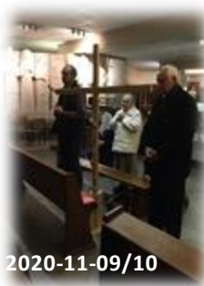
ZJAZDU KU CZCI ŚW. ANDRZEJA BOBOLI W WARSZAWIE, 2020-11-09/10