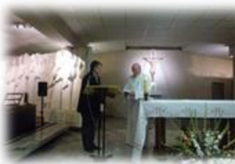
SANKTUARIUM ŚW. ANDRZEJA BOBOLI W WARSZAWIE